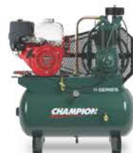
ACCIONAMIENTO POR MOTOR

Las características y las opciones varían entre las configuraciones de productos, ya que algunos elementos que pueden estar disponibles para una unidad doble tal vez no lo estén para una simple.