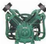
BOMBA DE COMPRESOR SIN ACCESORIOS