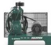
MONTAJE EN BASE